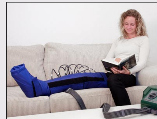
Lympha Press Mini med støvlemanchet