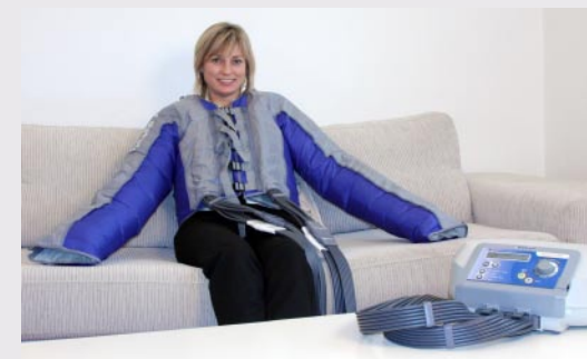
Lympha Press Optimal med jakkemanchet