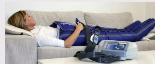
Lympha Press Optimal med buksemanchet

Vores pumper er nu udstyret med et nyudviklet click-on stik, så slangerne er lette at montere på pumpen.