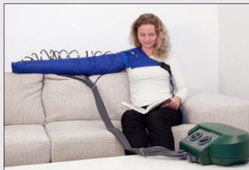
Lympha Press Mini med arm- og skuldermanchet

Lympha Press er et medicinsk dokumenteret elektrisk apparat, der kan afhjælpe brugerens gener forårsaget af bla. ødem i lymfe- og venesystemet.